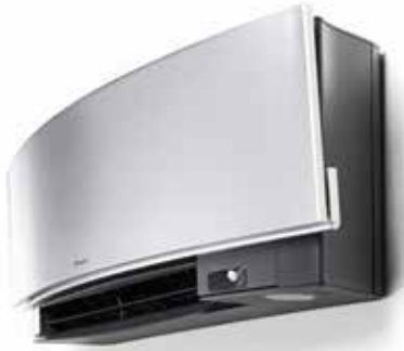
Fluisterstil tot 19 dB(A)

De intelligente sensor met twee zones regelt het comfort op twee manieren. Wanneer er langer dan 20 minuten niemand in de kamer is, wordt de ingestelde temperatuur aangepast om energie te besparen. Zodra iemand de kamer binnenkomt, keert de unit automatisch terug naar de oorspronkelijke temperatuur. De intelligente sensor met twee zones zorgt er ook voor dat de luchtstroom wordt weggeleid van mensen in de kamer zodat koude tocht wordt vermeden.